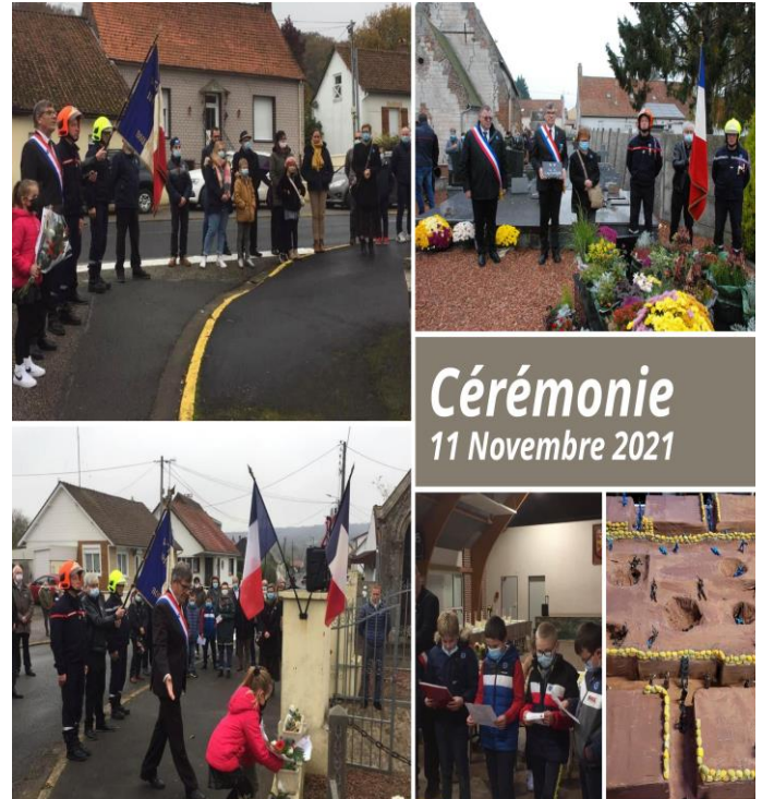
Cérémonie 11 Novembre 2021

Ils étaient nombreux à s'être déplacés pour se joindre à l'hommage aux soldats et faire découvrir la maquette qu'ils ont fabriquée en projet de classe.