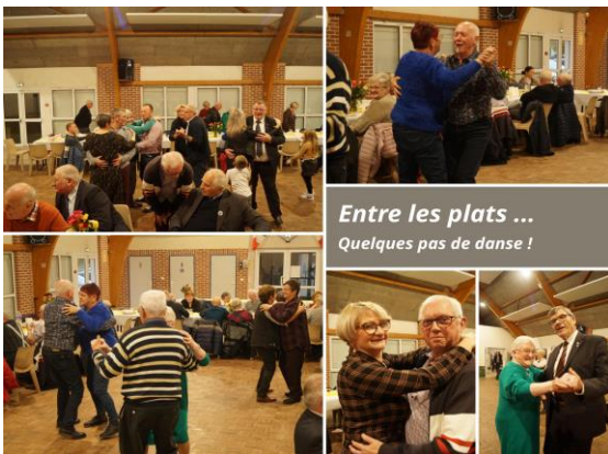
Entre les plats ... Quelques pas de danse !

Entre les plats, les convives ont apprécié faire quelques pas de danse...mais aussi de finir le repas par une « petite poire » !