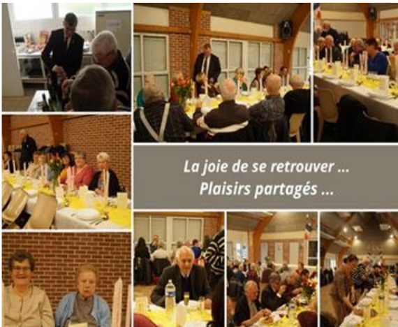
La joie de se retrouver ... Plaisirs partagés ...

Des sourires nombreux à table comme en cuisine ou au service !