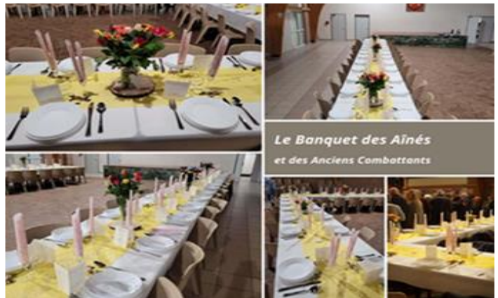
Le Banquet des Aînés et des Anciens Combattants