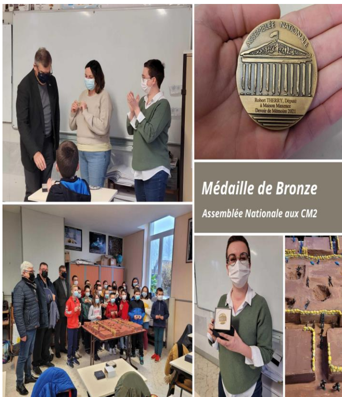
Médaille de Bronze Assemblée Nationale aux CM2

Nous saluons ce projet mené par Mme Proix avec ses élèves, citoyens de demain.