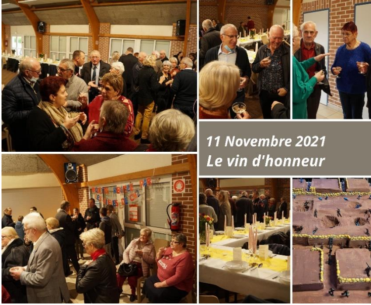
11 Novembre 2021 Le vin d'honneur

Cette année, la situation sanitaire a permis à la population de se réunir autour du vin d'honneur après la cérémonie aux Monuments, puis pour le traditionnel banquet des Aînés et des Anciens Combattants.